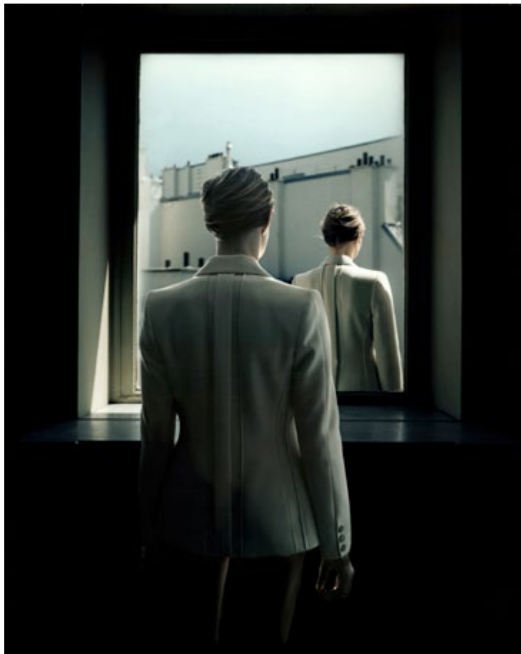
ANAMORPHÉE - PHOTOGRAPHY